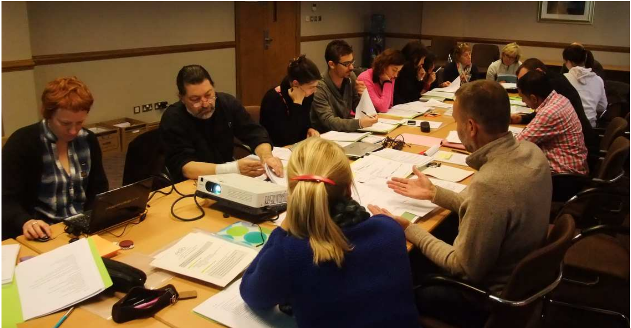
Ambiance studieuse à Northumbria University de Newcastle (Nord-Est Angleterre) les 10 et 11 juin derniers

Le projet AGID est un projet européen visant à construire des modules de formation à l'adresse des professionnels accompagnant les personnes en situation de handicap intellectuel avançant en âge. Financé par l'Agence Exécutive de la Commission Européenne, ce projet œuvre à la construction d'un programme de formation qui présentera l'originalité d'être accessible sur un portail web. En cours de co-élaboration au sein d'un consortium multinational regroupant des partenaires motivés et soucieux de pouvoir répondre au mieux aux besoins particuliers et évolutifs de cette « nouvelle » population 1 , le programme apportera des réponses diversifiées aux différents collaborateurs.